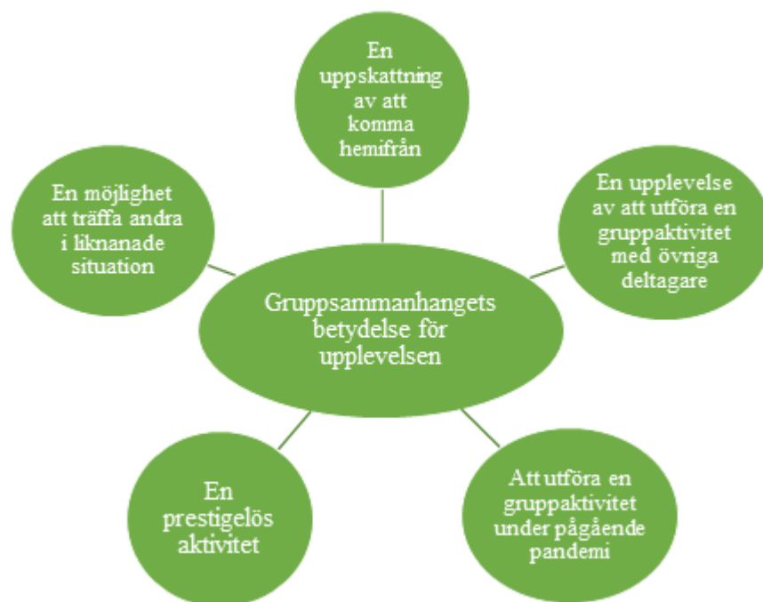
Figur 1. Figuren påvisar de primära koder som genererat temat "Gruppsammanhangets betydelse för upplevelsen".